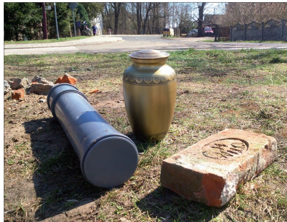
Kamień węgielny, urna z ziemią z Huciska i cegła ze zrujnowanego kościoła w Hucisku (cegielnia Bóbrka).

Niech ten Pomnik będzie drogowskazem życiowym dla dzisiejszych i przyszłych pokoleń.