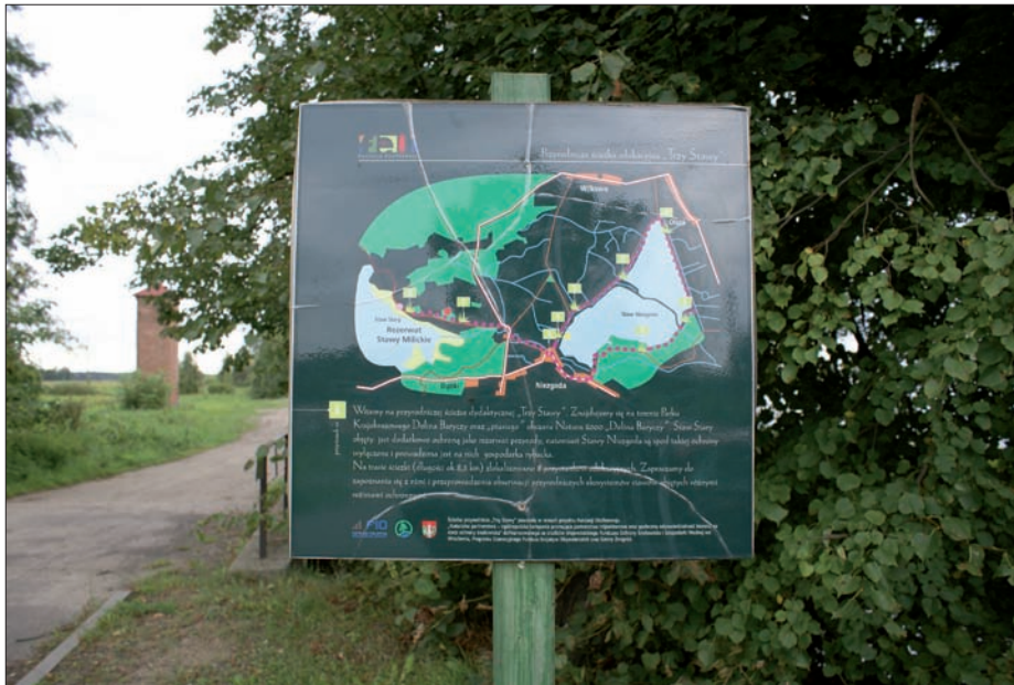
Niezgoda - tablica informacyjna ścieżki „Trzy Stawy”, 2012 r.