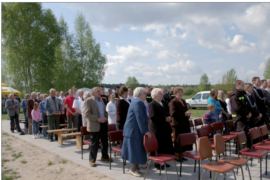
Msza święta polowa, 2 maja 2008 r.