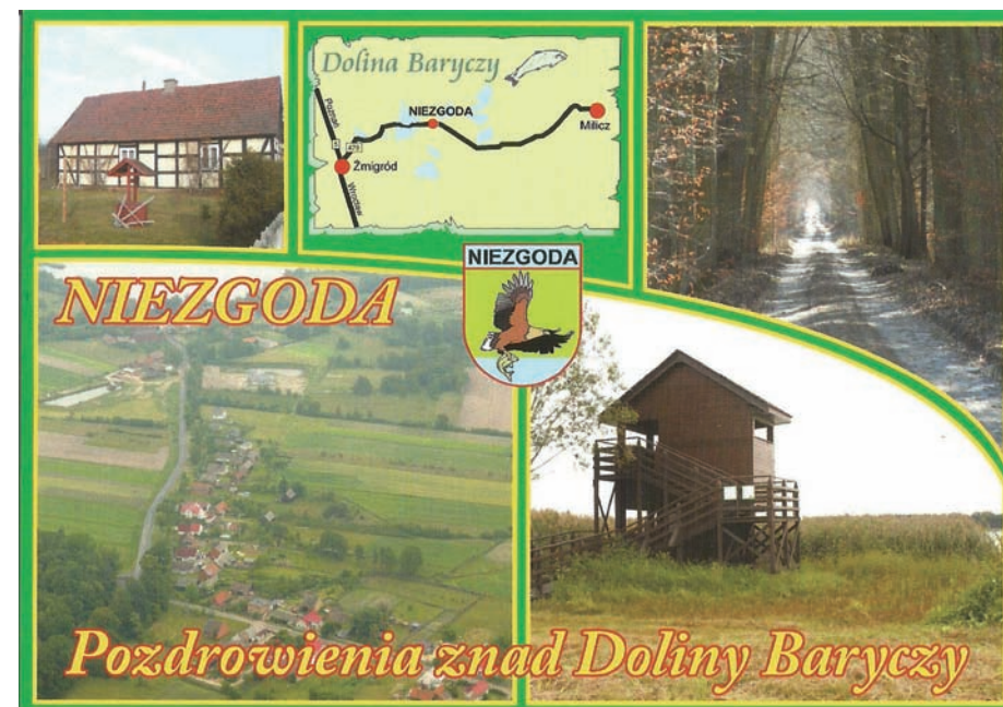
Niezgoda - pocztówka. Projekt: www.jarmi.pl.