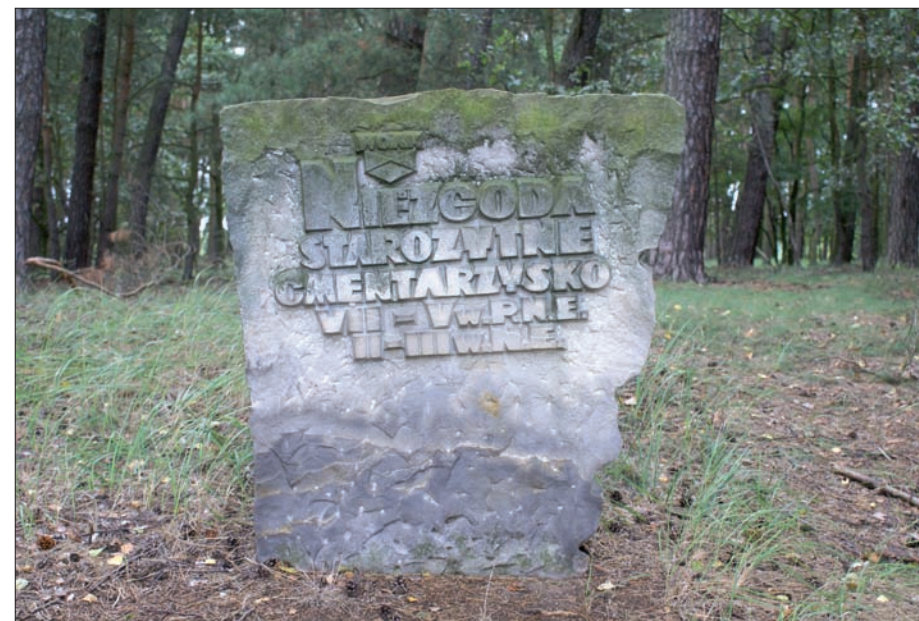
Niezgoda - kamień w miejscu starożytnego cmentarzyska, 2012 r.