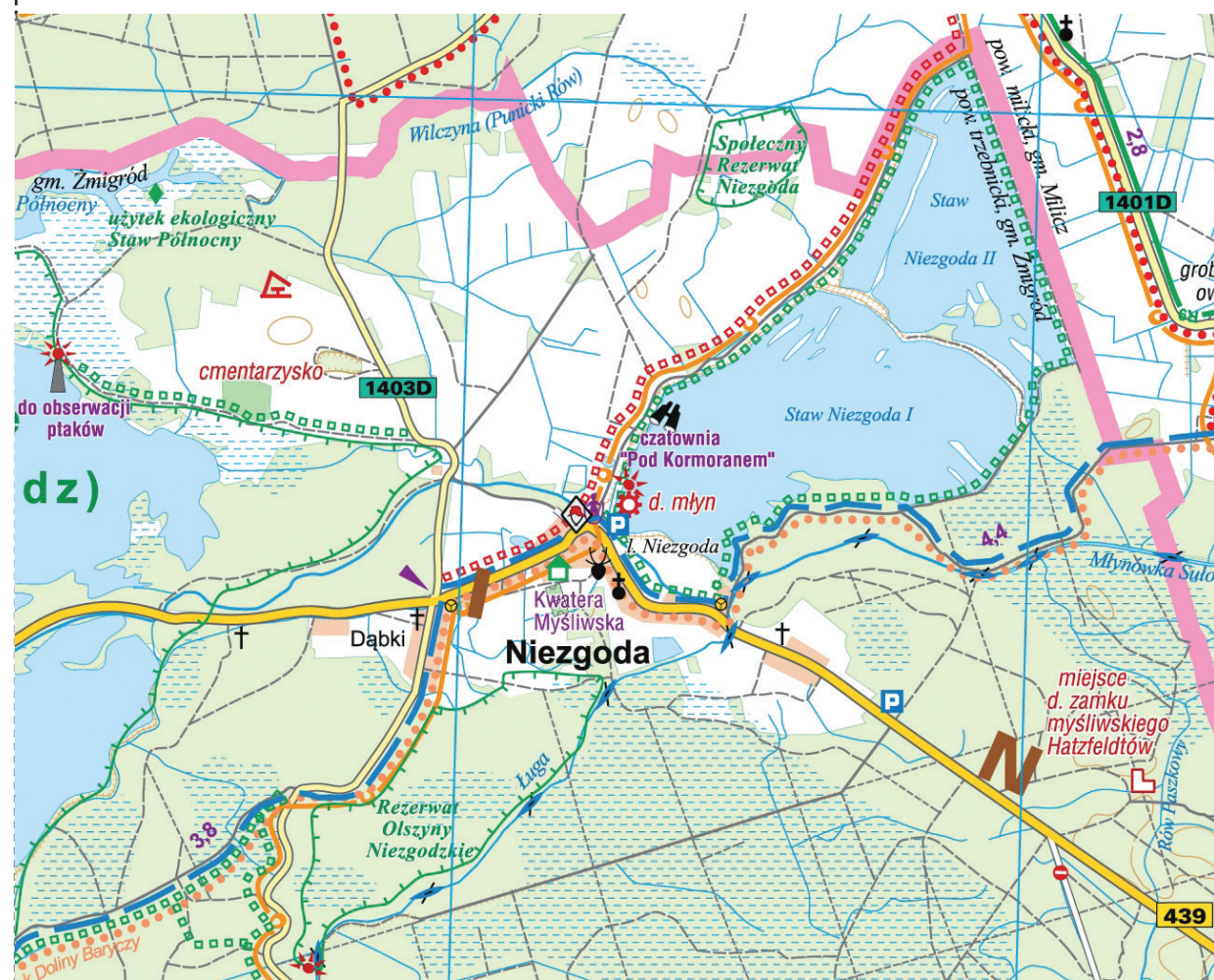
Niezgodza i okolice - fragment mapy gminy Żmigród.