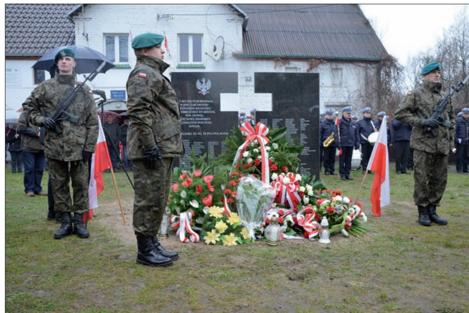
Uroczystości w dniu 10 kwietnia 2016 r. - odsłonięty pomnik po złożeniu wieńców i zapaleniu zniczy.