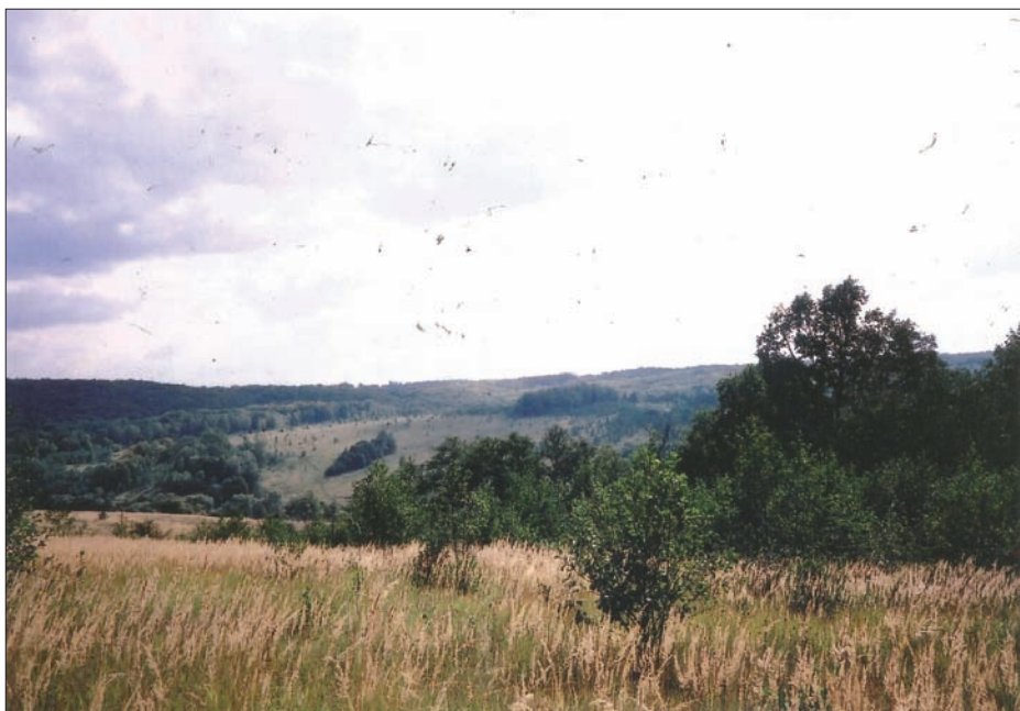
Hucisko w dniu 14 września 2003 r., widok na część zachodnią od strony Rakowca.