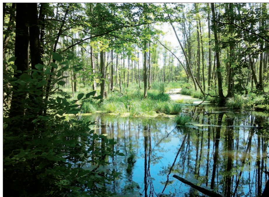
Niezgoda - rezerwat „Olszyny Niezgodzkie”, czerwiec 2013 r.