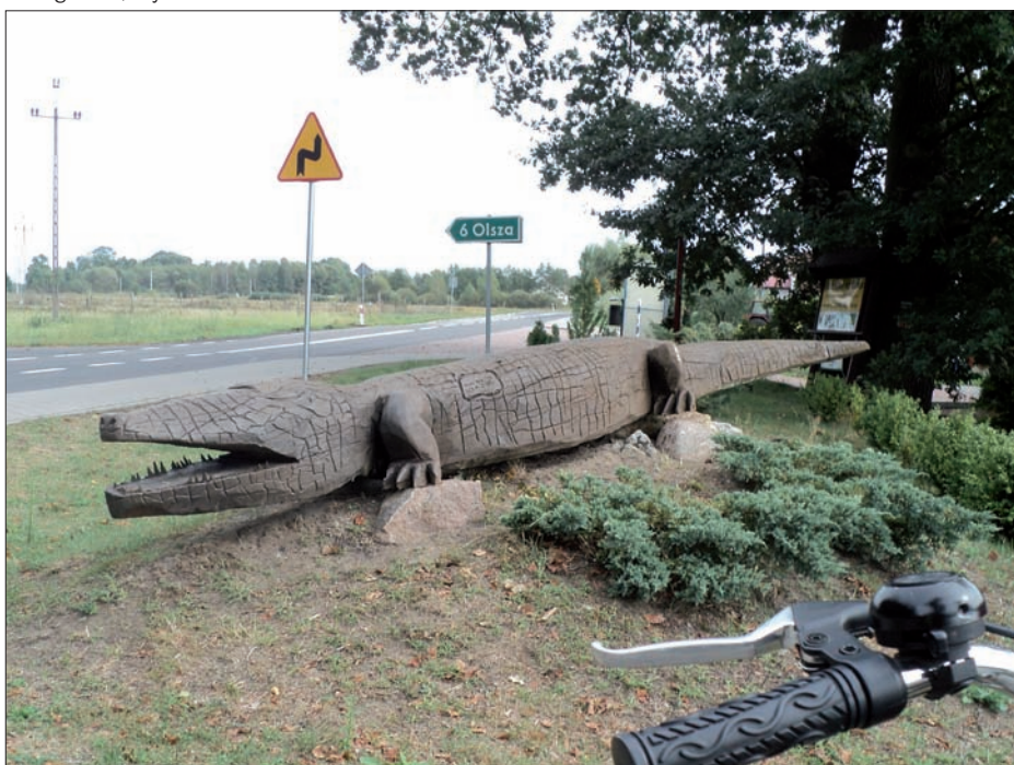
Krokodyl niezgodzki, wrzesień 2015 r.