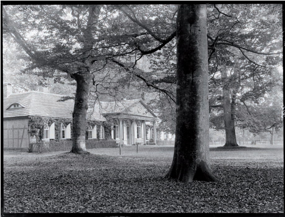
Pałacyk myśliwski.