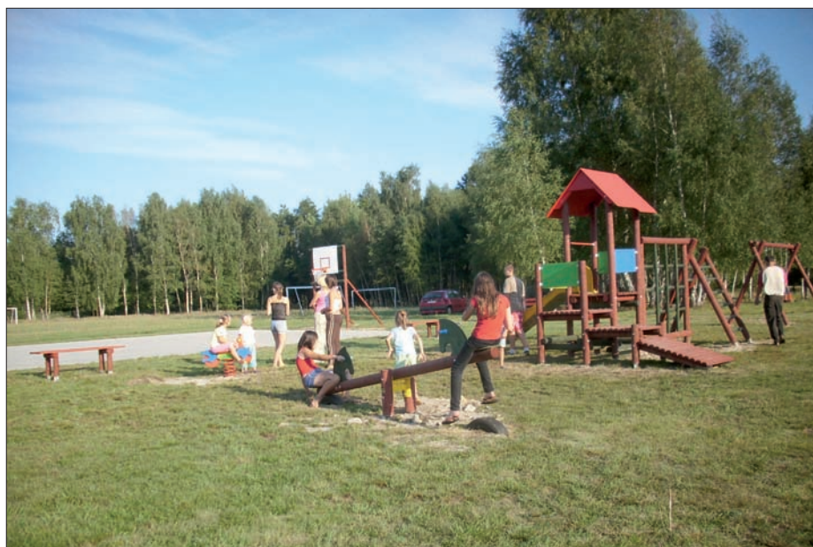
Na placu zabaw w Niezgodzie, sierpień 2008 r.