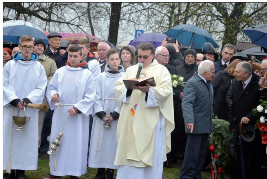
Uroczystości w dniu 10 kwietnia 2016 r. - ceremonia poświęcenia pomnika.