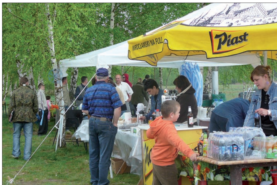
Festyn, 2 maja 2008 r.