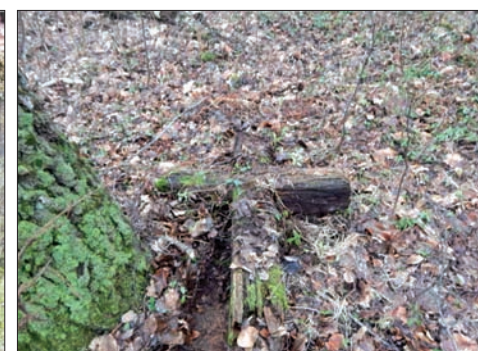
Zdjęcia wykonane podczas sentymentalnej podróży w marcu 2016 r.