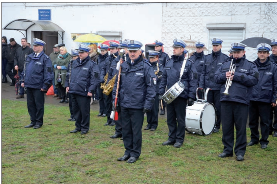
Uroczystości w dniu 10 kwietnia 2016 r. - Orkiestra Dolnośląskiej Komendy Wojewódzkiej Policji.