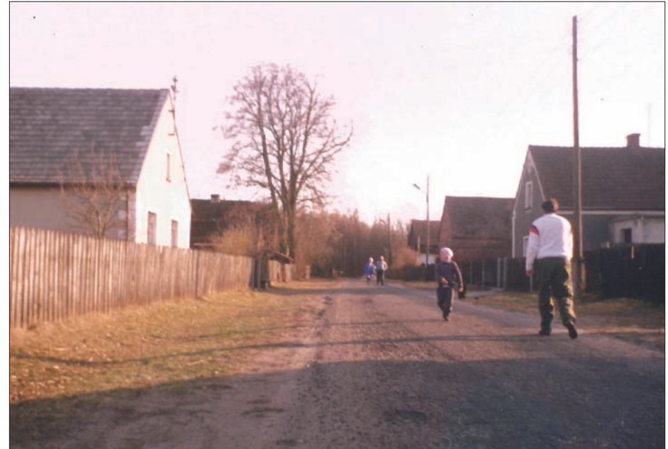
Niezgoda - ul. Piaskowa, koniec lat 90.