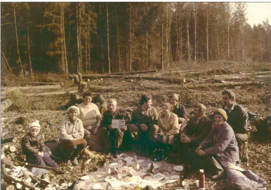
Dzień Kobiet w 1989 r.