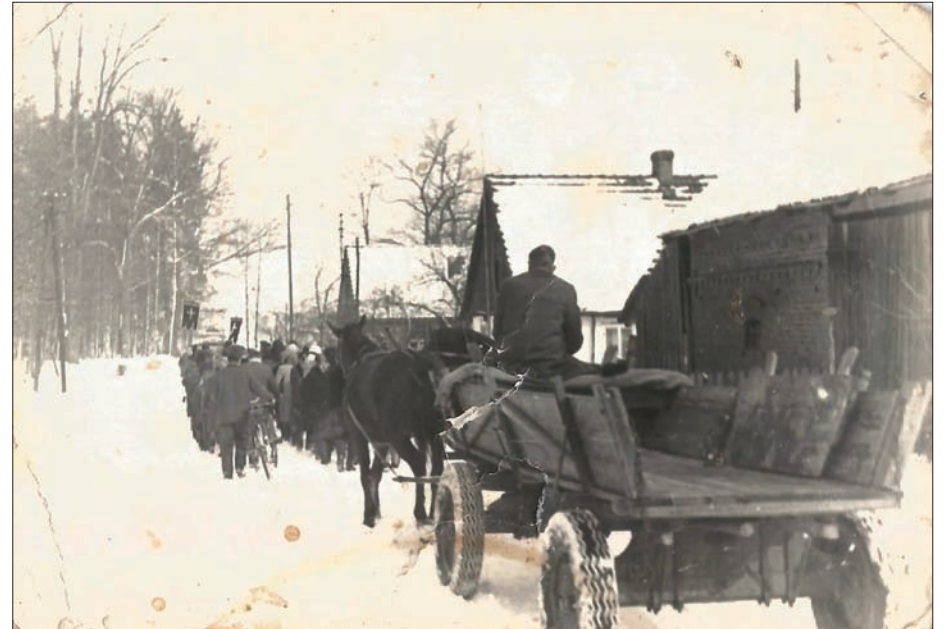
Ulica Piaskowa w Niezgodzie, 1970 r. - pogrzeb śp. Jadwigi Tarnowskiej.