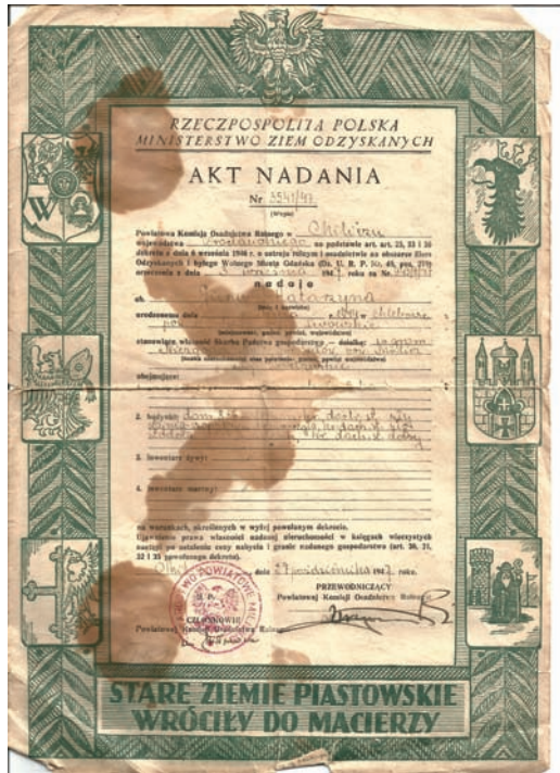
Akt Nadania.

Aby upamiętnić to wielkie wydarzenie, w kamieniu węgielnym tegoż pomnika,