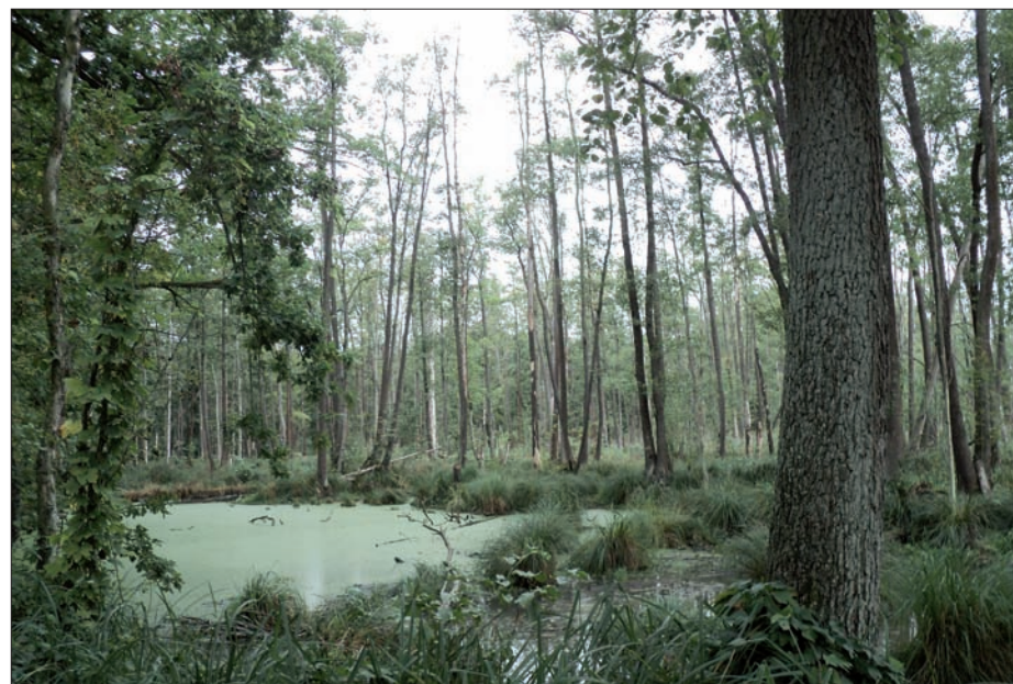
Niezgoda - rezerwat „Olszyny Niezgodzkie”, wrzesień 2015 r.