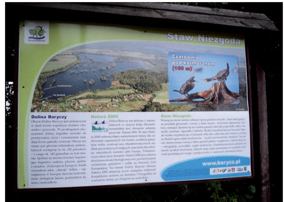
Niezgoda - tablica informacyjna, sierpień 2015 r.