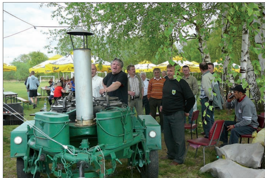
Festyn, 2 maja 2008 r.