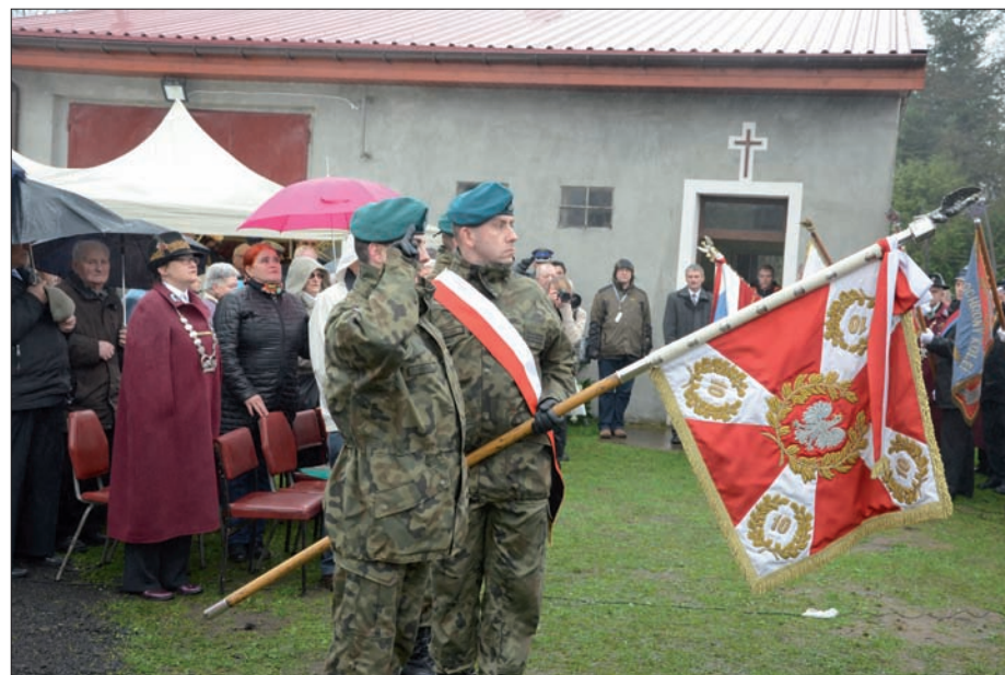
Uroczystości w dniu 10 kwietnia 2016 r. Poczet sztandarowy kompanii honorowej Wojska Polskiego wystawionej przez 10. Wrocławski Pułk Dowodzenia.