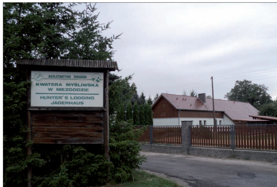
Niezgoda - kwatera myśliwska, sierpień 2015 r.