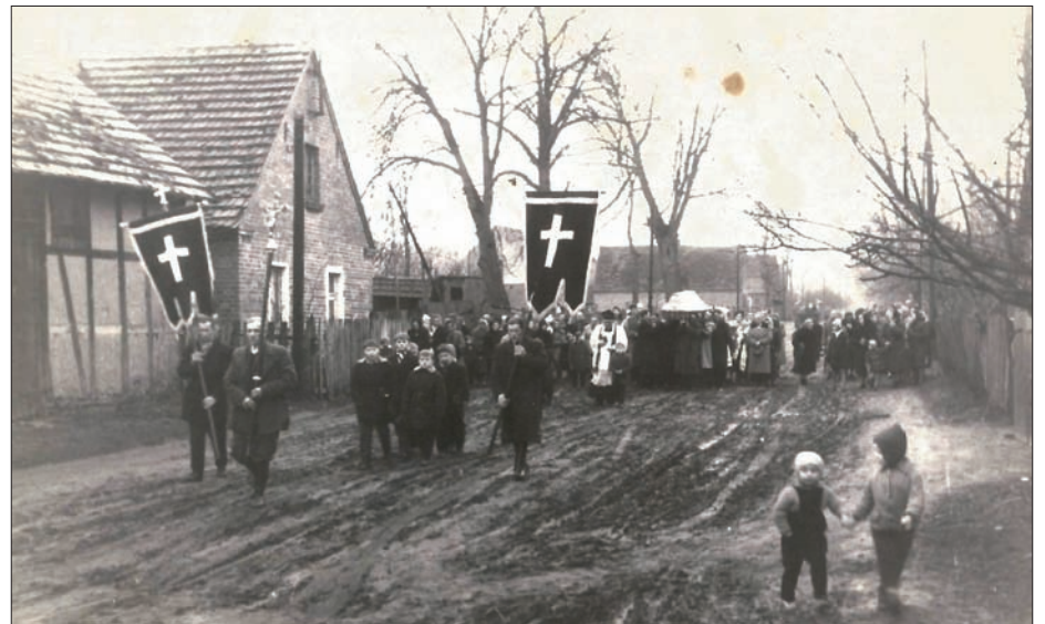
Pogrzeb w Niezgodzie ok. 40 lat temu - kondukt szedł z domu do krzyża, dalej autem lub wozem do Radziądza.