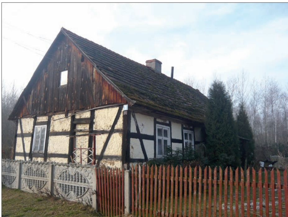
Niezgoda..., styczeń 2009 r.