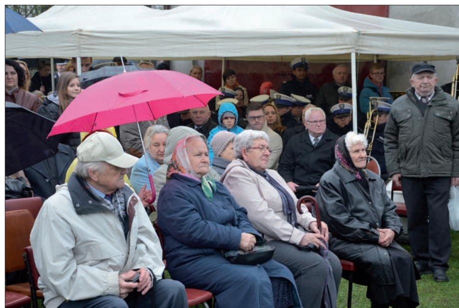
Uroczystości w dniu 10 kwietnia 2016 r. - podczas mszy świętej.