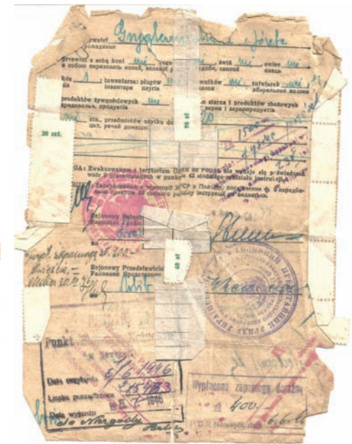
Karta ewakuacyjna.