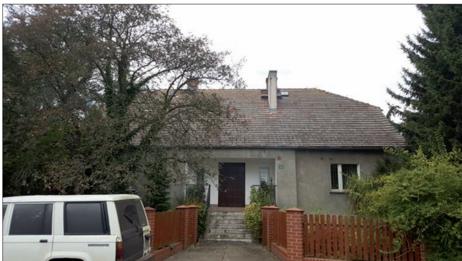
Leśniczówka w Niezgodzie, 2018 r.