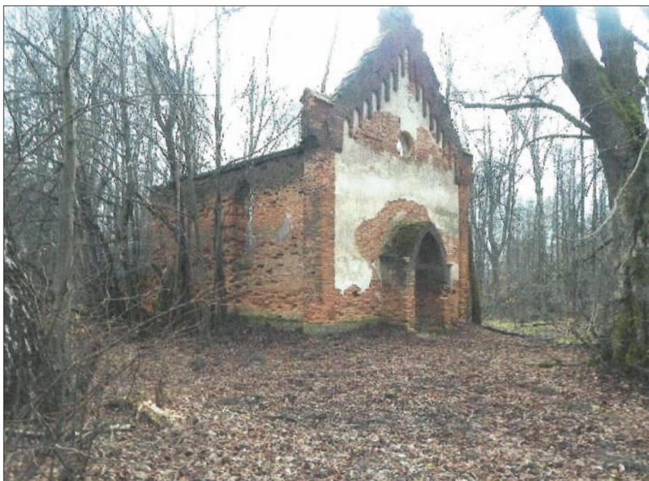
Kościółek w Hucisku - to, co z niego pozostało..., marzec 2016 r.