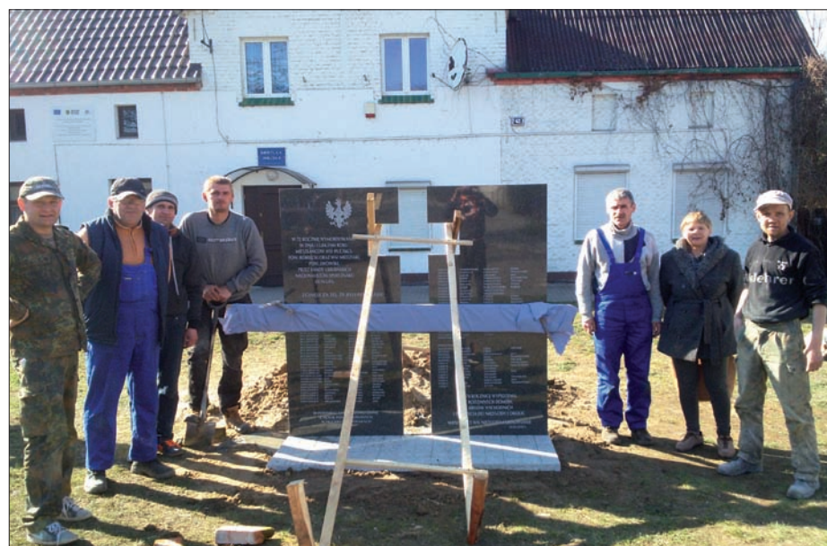
Niezgoda - montaż pomnika pamięci pomordowanym w Hucisku i w Miedziakach, 2 kwietnia 2016 r.