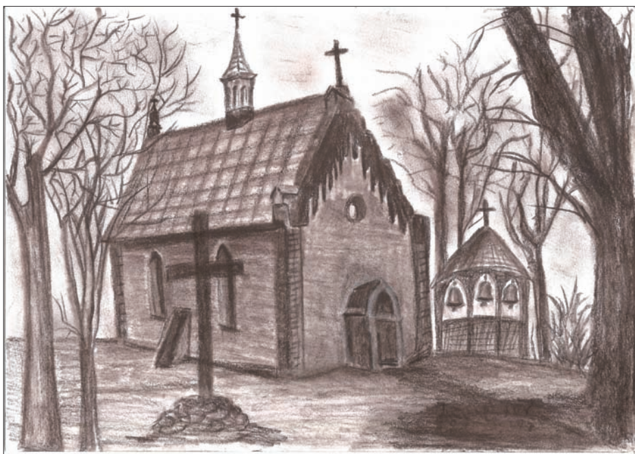
Kościółek w Hucisku, rys. Iwona Mazur.