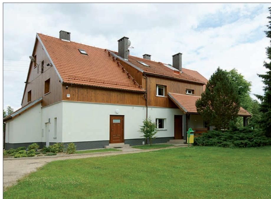
Niezgoda - kwatera myśliwska, 2014 r.