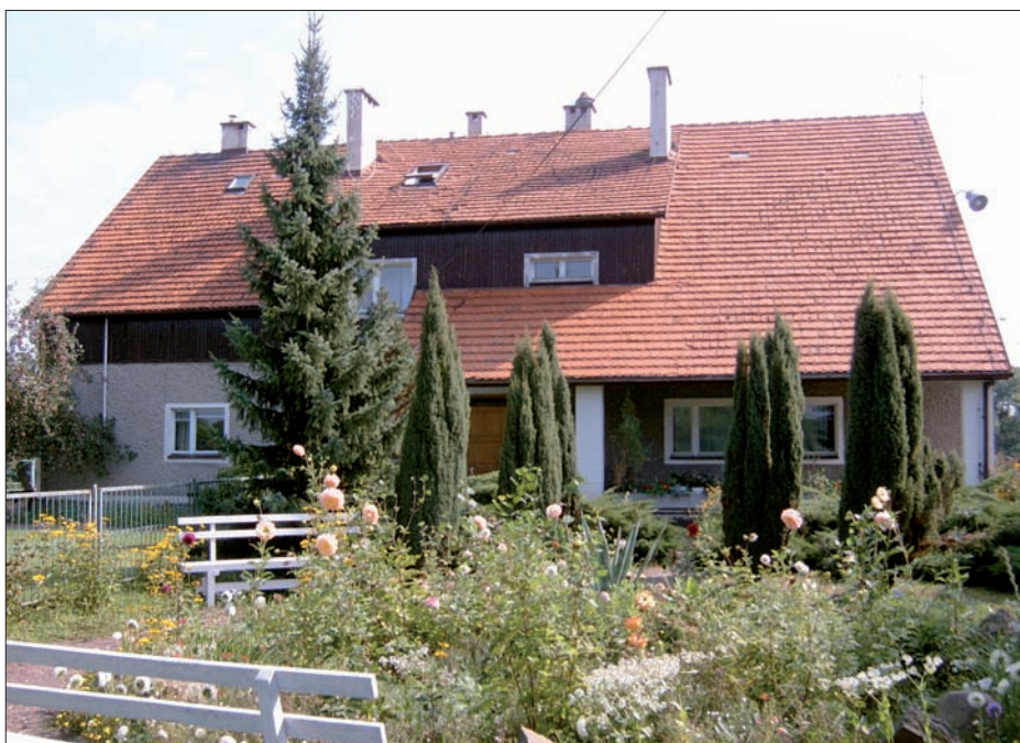
Niezgoda - kwatera myśliwska, 2002 r.