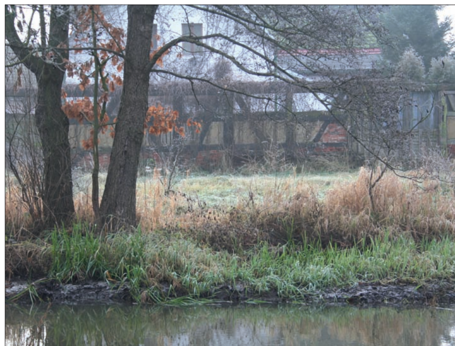
Nad niezgodzkim stawem..., grudzień 2006 r.