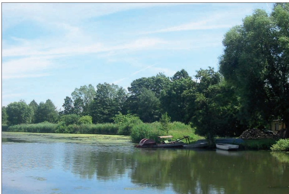
Niezgoda - Staw Niezgoda, 2005 r.