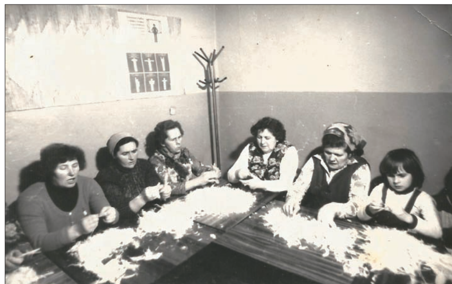
Pierzajki w świetlicy.