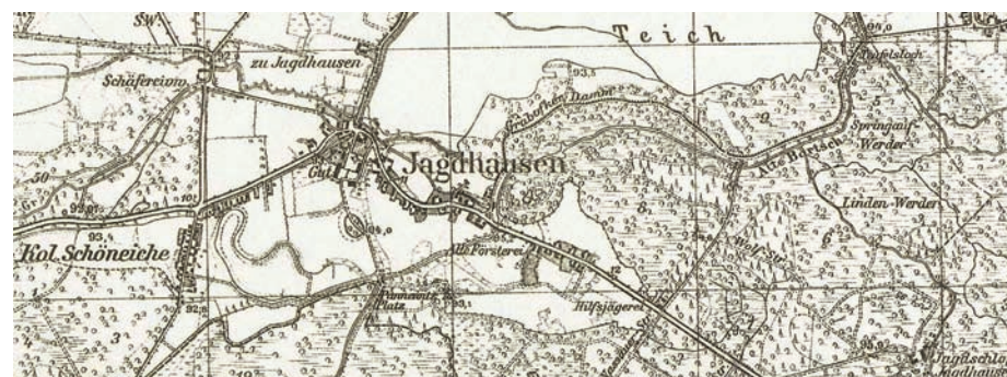
Niezgodzie i najbliższe okolice Fragment niemieckiej Mapy Messtischblatt 4468 z 1940 r.