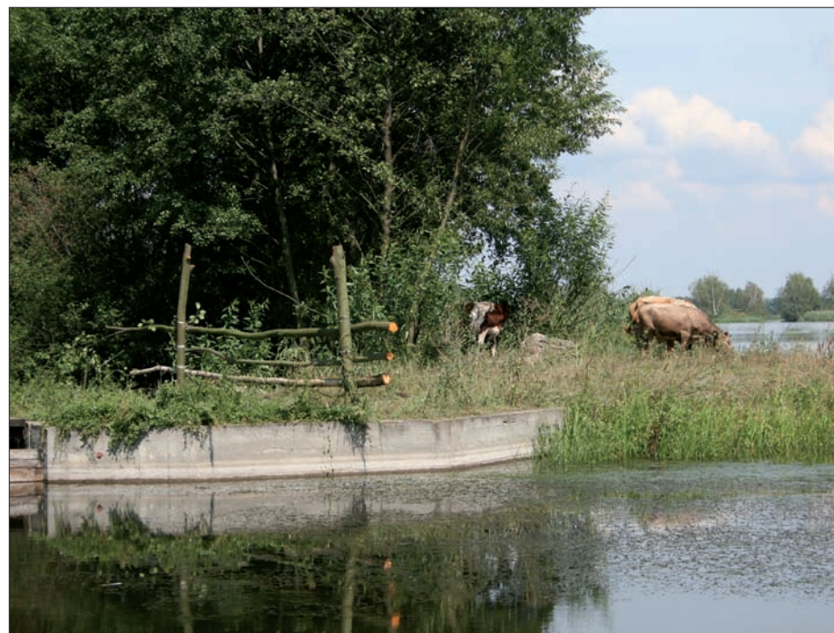
Nad niezgodzkim stawem..., sierpień 2006 r.