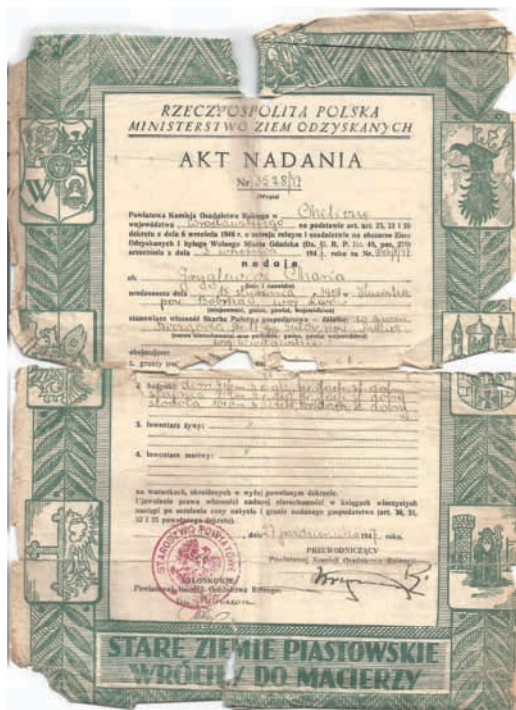
Akt nadania.