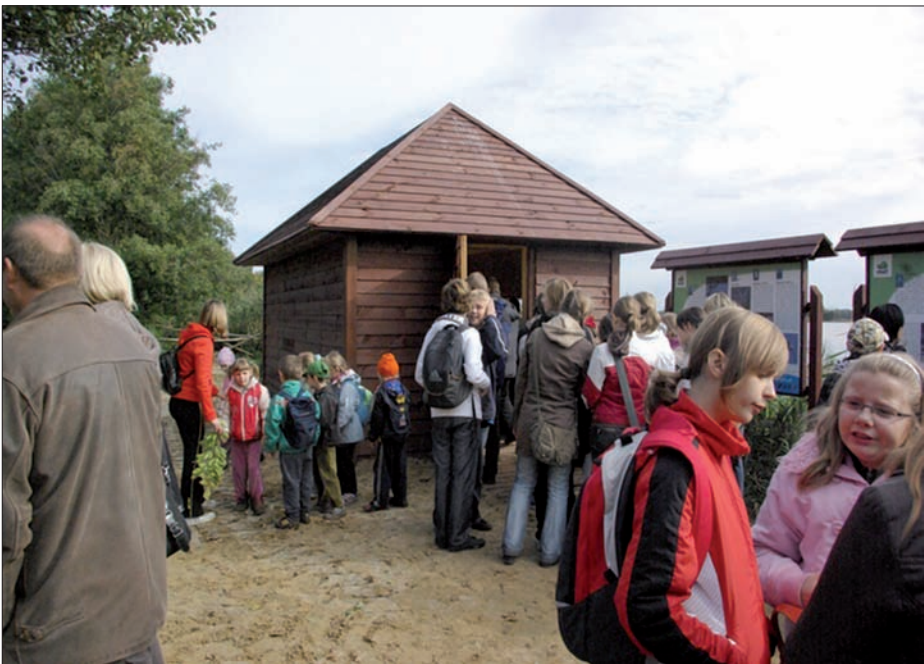
Otwarcie chatowni przy stawie w Niezgodzie.