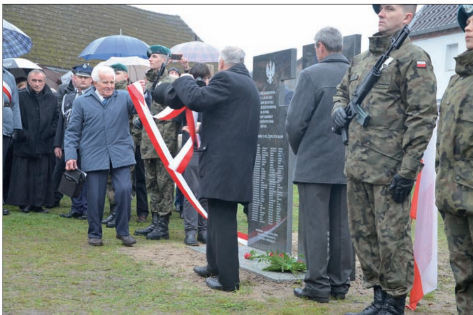
Uroczystości w dniu 10 kwietnia 2016 r. - odsłonięcie pomnika.