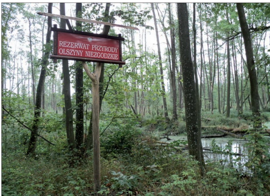
Niezgoda - rezerwat „Olszyny Niezgodzkie”, wrzesień 2015 r.