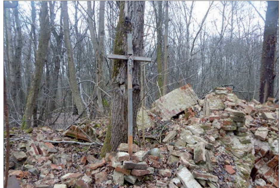
W marcu 2016 r. ...