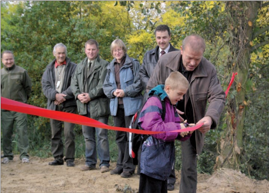
Otwarcie chatowni przy stawie w Niezgodzie.