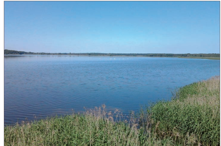
Rezerwat „Stawy Milickie” – widok z wieży widokowej na Staw Stary, czerwiec 2013 r.