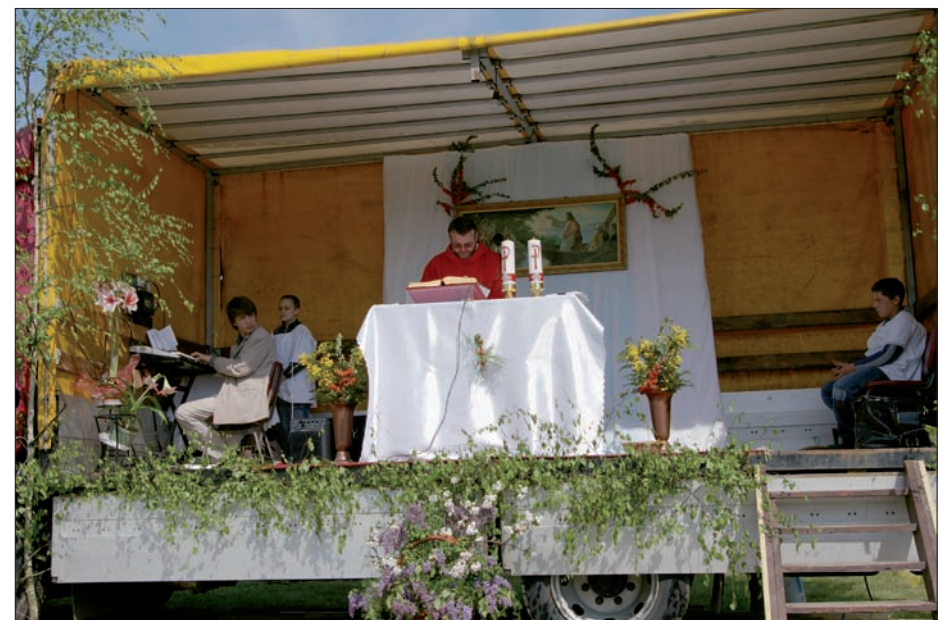
Msza święta polowa, 2 maja 2008 r.